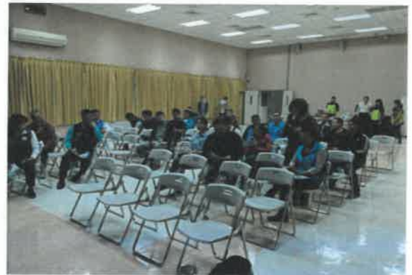
與會人員發言(中庄里)