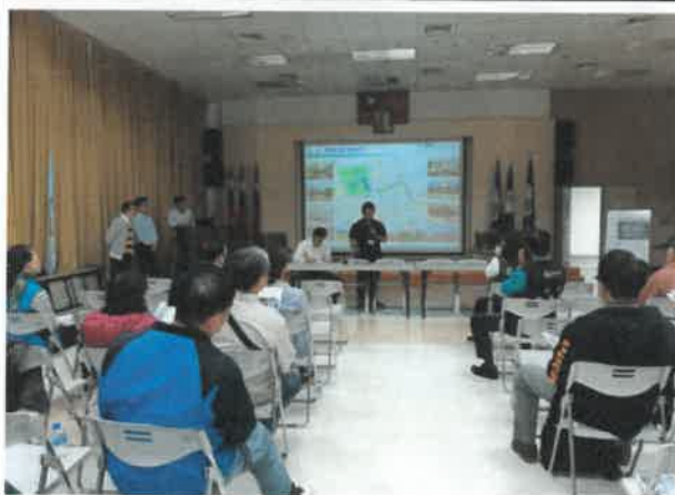
本府觀光新聞處發言