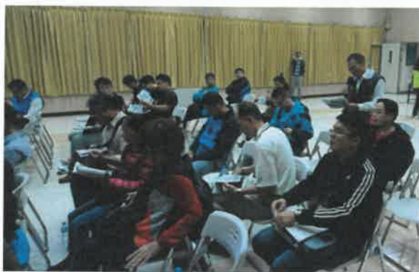
與會人員發言(北榮里)